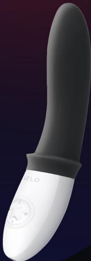
LELO BILLY (massage prostatique)